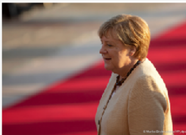
السبت 14 سبتمبر 2021 16 عام بالمنطقة - حقائق ومعلومات في حياة أنجيلا ميركل